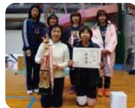
A級 準優勝 宿場