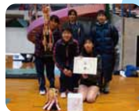
A級 優勝 フレンズ