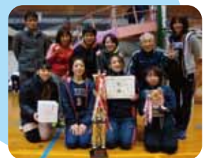
B級 優勝 さくら